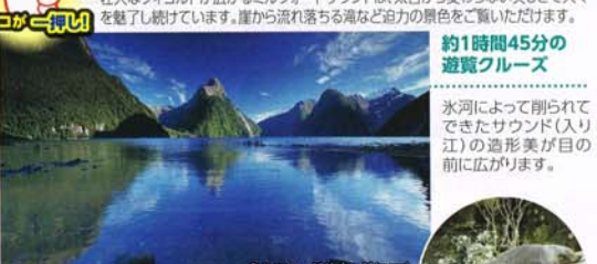
ミルフォードサウンド (P57)

3日目 世界遺産 ミルフォードサウンド観光 壮大なフィヨルドが広がるミルフォードサウンドは、太古から変わらぬ美しい大自然を魅了し続けています。崖から流れ落ちる高など迫力の景色をご覧ください。