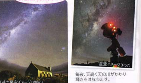
テカポ湖の星空イメージ (P99c)

星空のベストシーズン! (冬~8月)は空気が冷え込み、より星が美しく見える季節です。