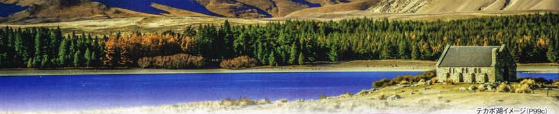
テカポ湖イメージ (P99c)

オークランドにて うれしい昼食 1回! (一部出発日を除く) 詳しくは1ページ参照