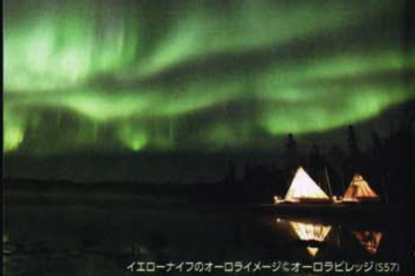
イエローナイフのオーロライメージ&オーロラビレッジ (S57)