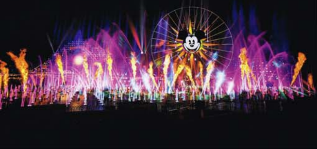
ワールド・オブ・カラー