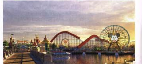
ピクサー・ピア © Disney/Pixar

2つのテーマパークを1日何度でも入場できる 2デー・ディズニーランド・リゾート・パークホッパー・チケット付!