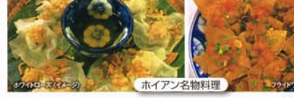
ホイアン名物料理